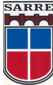
Landesbibliothek des Saarlandes