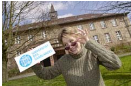
Universitätsbibliothek der Universität des Saarlandes